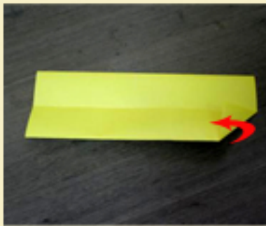
5. Doblas una esquina hacia el centro