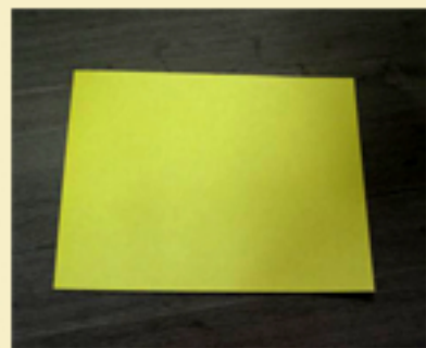
1. Una hoja de papel