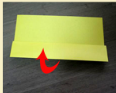
3. Haces un dobléz hacia el centro