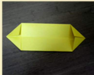
6. Haces lo mismo con las otras esquinas