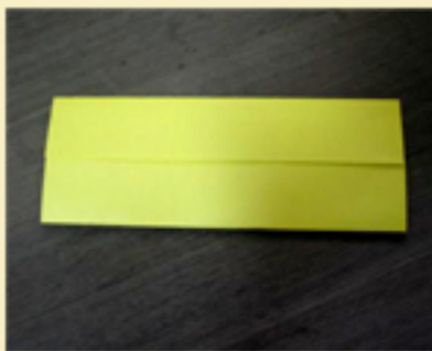
4. Doblas el otro lado